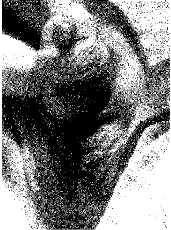
Şekil 1: Vertikal insizyon sonrası kistin açığa çıkması.

Polikliniğimize başvuran 3 yaşındaki erkek hasta, 8 ay önce yaşadığı ilçedeki bir sağlık memuru tarafından sünnet edilmişti. Sünnet olduktan bir müddet sonra penis dorsalinde bir şişkinlik olduğu söylendi. Bu şişkinliğin zaman zaman arttığı, zaman zaman azaldığı belirtildi. Kliniğimize başvurduğunda penis dorsalinde 1x1.5 cm boyutlarında, palpasyonda yumuşak ve ağrılı bir şişlik mevcuttu. Kitle üzerindeki cilt hiperemikti ve çevre cilde göre sıcaklığı artmıştı. Hastaya antibiyotik tedavisi uygulandı. Tedavisi tamamlandıktan sonra genel anestezi altında opere edildi. Çevre dokuya fibröz yapışıklık gösteren ve belirgin bir kapsül ayırdedilemeyen kitle çıkarıldı. Histopatolojik inceleme sonucu epidermal inklüzyon kisti olarak geldi.