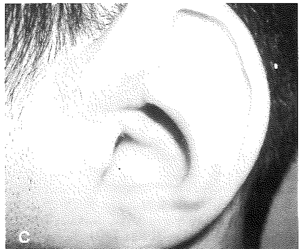
Şekil 2A: Olgu 2’nin sol kulağında lokalize 35x35x30 mm boyutlarındaki arterivenöz malformasyonun görünümü. B: Olgu 2’nin postoperatif 6. ayda önden görünümü. C: Olgu 2’nin postoperatif 6. ayda yandan görünümü.