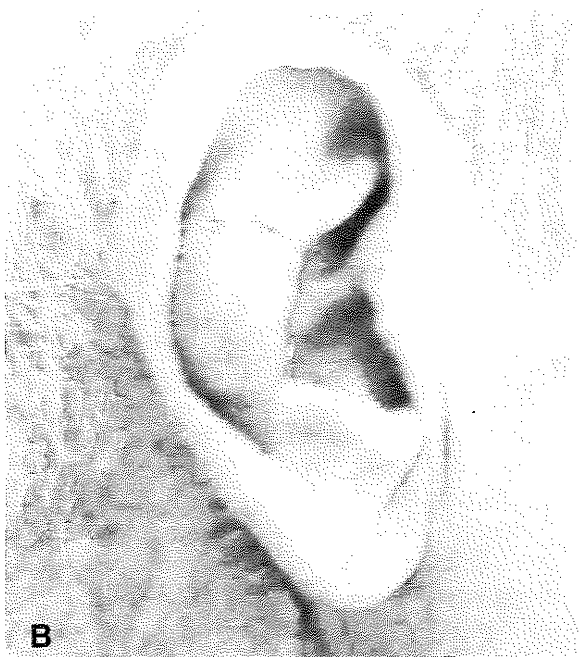
Şekil 1A: Olgu 1’in sağ kulağında lokalize BCC eksizyonu sonrası oluşan 15x25 mm boyutlarındaki doku defektinin görünümü. B: Olgu 1’in postauriküler dezepitelize dermal pediküllü flep ile onarım sonrası 1. aydaki görünümü