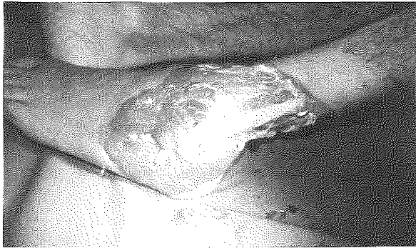
Şekil 1: Sol ayak bileği ve bacak distal 1/3'ünü içine alan yaygın doku defekti. Fibula ve tendonlar ekspoze durumdadır.

54 yaşında erkek hasta sol alt ve üst ekstremitede elektrik yanığı nedeni ile Kasım 2002'de kliniğimize başvurdu. Doku hasarının ilerlemesi ile sol kola dirsek altı amputasyon uygulandı. Debridmanlar sonrası sol ayak , ayak bileği laterali, bacak distalini içeren, kemiği ve eklemini açıkta bırakan doku defekti gelişti (Şekil 1). Defekt ilk olarak ipsilateral latissimus dorsi kas-deri flebi ile rekonstrükte edildi. Flebin torakodorsal arteri ile hasarlı bacağın posterior tibial arteri arasında anastomoz gerçekleştirildi. Postoperatif 4. günde flepte arteriyel yetmezlik gelişmesi nedeniyle revizyona alındığında arteriyel trombus saptandı.Arter kısaltılıp araya ven grefti konularak anastomozlar tekrarlandı. Flep, 5. günde tekrar arteriyel trombus gelişmesi üzerine kaybedildi. Postoperatif 30. günde karşı taraf latissimus dorsi kas- deri flebi kaldırıldı ve flep, arteriyel ve venöz anastomozları hasarsız bacağın tibialis posterior ve vena comitantesine olacak şekilde, serbest olarak defekte