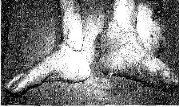
Şekil 4: Pedikül ayrılıp fasyokütan flebin yerine iade edildikten sonraki görünüm

yayınlanmıştır. Pediküllü serbest flep 4 olarak da tanımlanan bu prosedür konvansiyonel serbest fleplerin ve lokal fleplerin yetersiz kaldığı durumlarda ekstremitelerdeki komplike defektlerin örtülmesinde yeterli doku transferine imkan sağlamaktadır. Oldukça nadir uygulanan bu yöntem ilk tercih olmamalı, diğer yöntemlerin başarısız olduğu veya başarısız olacağı kuvvetle muhtemel olgularda uygulanmalıdır. Aynı ekstremitedeki artere uç yan anastomoz teknik olarak zordur ve eğer bacağın beslenmesi bu tek artere bağlı ise trombus geliştiğinde katastrofik olabilir.