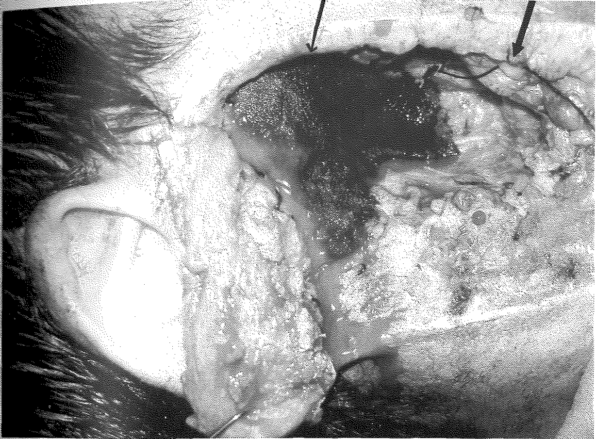
Resim 2: Olgunun hemostaz sonrası görünümü İnce ok: Uygulanan cerrahinin göstergesidir. Kalın ok: Retromandibuler venin ligasyon sonrası görünümünü belirtmektedir.

değerlendirilmesinin hayatı tehdit edebilecek kanamaların önlenmesinde önemli olduğunu düşünüyoruz. Ayrıca olgumuzda olduğu gibi fasiyal paralizi ve benzeri iatrojenik ciddi komplikasyonlar bu şekilde azaltılabilir.