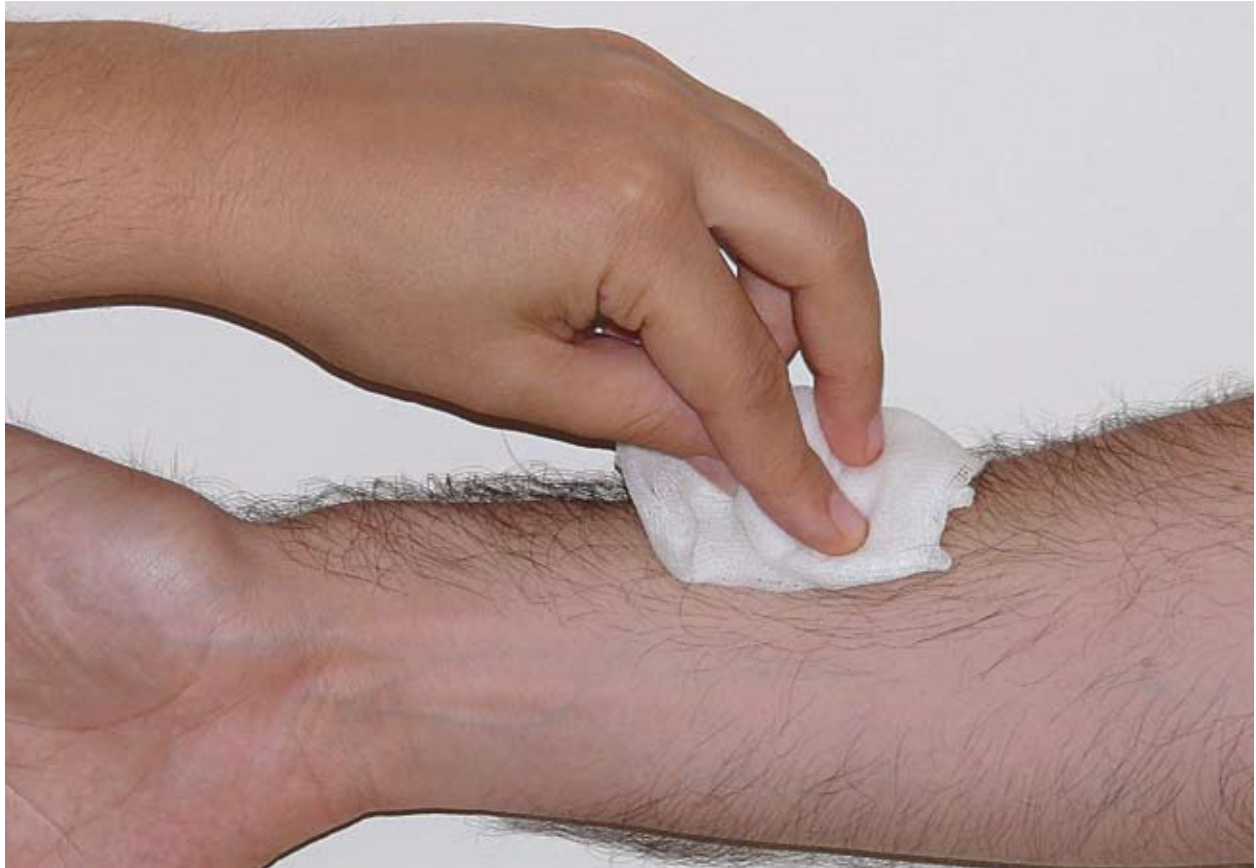
Şekil 1: Alkol ile radial tarafın silinme işlemi.

Ameliyat öncesi yapılan çizimlerin kalıcı olması plastik cerrahide çok büyük öneme sahiptir. Çizimlerin hastanın pozisyonu ile değiştiği çok bilinen bir durumdur. Bu sebeple aynı çizim veya ölçümler hasta yattıktan sonra tekrar elde edilemez. 1 Ayrıca çizimlerin tekrar yapılması mümkün bile olsa çok zaman alıcı bir süreçtir. Çizimlerin kalıcı olmasını sağlamak amacı ile bir enjektör iğnesi veya benzeri bir sivri cisimle epidermisen çizilmesi 2